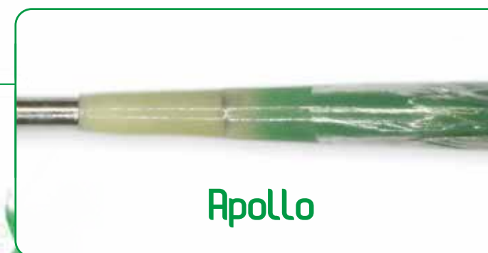
先端チップ拡大写真